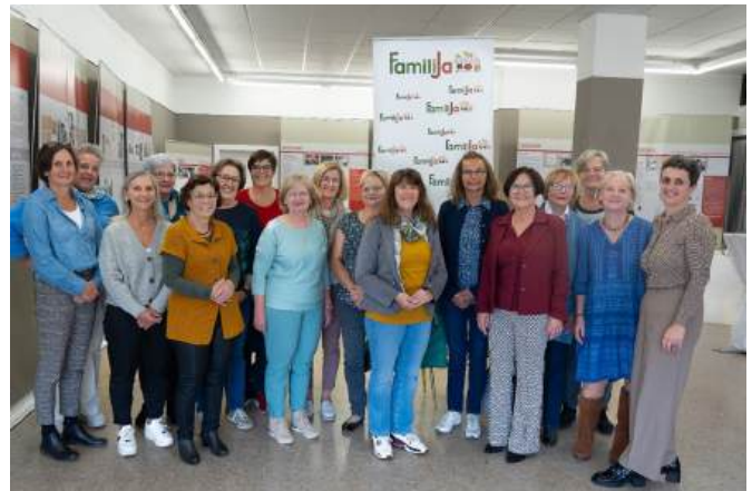
Hospizteam Mölltal FamiliJa